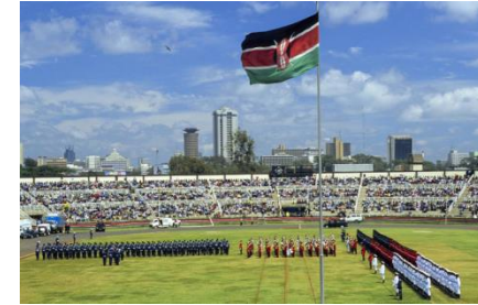
#1 Nation Hood