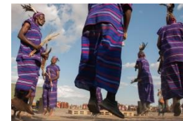
#3 Roots & Culture